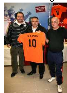
AS de Fanchon

Toutes les équipes sont concernées quelque soit le niveau où elles évoluent dans les compétitions. Le challenge est reconduit pour l'actuelle saison.