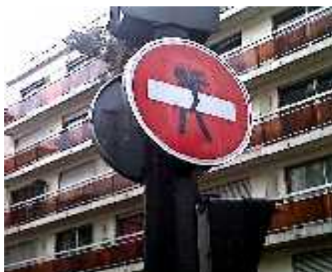
Certains prennent le sens interdit à Paris, d'autres le vole !!