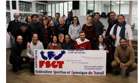
Le nouveau comité directeur

Le compte-rendu complet de la réunion sera diffusé prochainement.