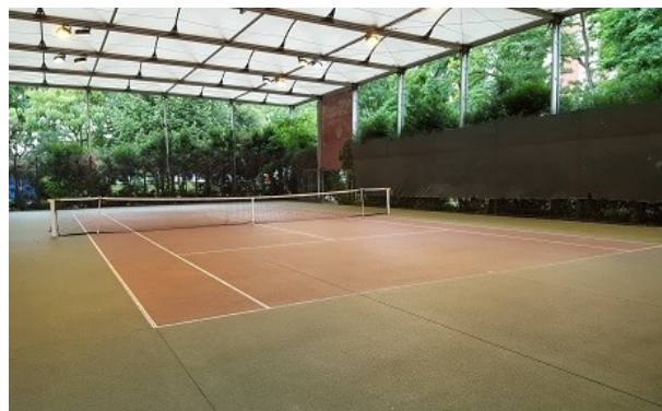
Court Dejerine – Porte de Montreuil 20ème